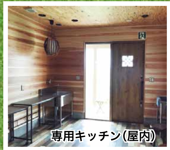
専用キッチン(屋内)

「day=日中」と「キャンプ」を掛け合わせた言葉で、宿泊しない日帰りで行うキャンプの事です。のんびりとバーベキューや焚き火、読書などをしてご自由にお過ごし頂けます。